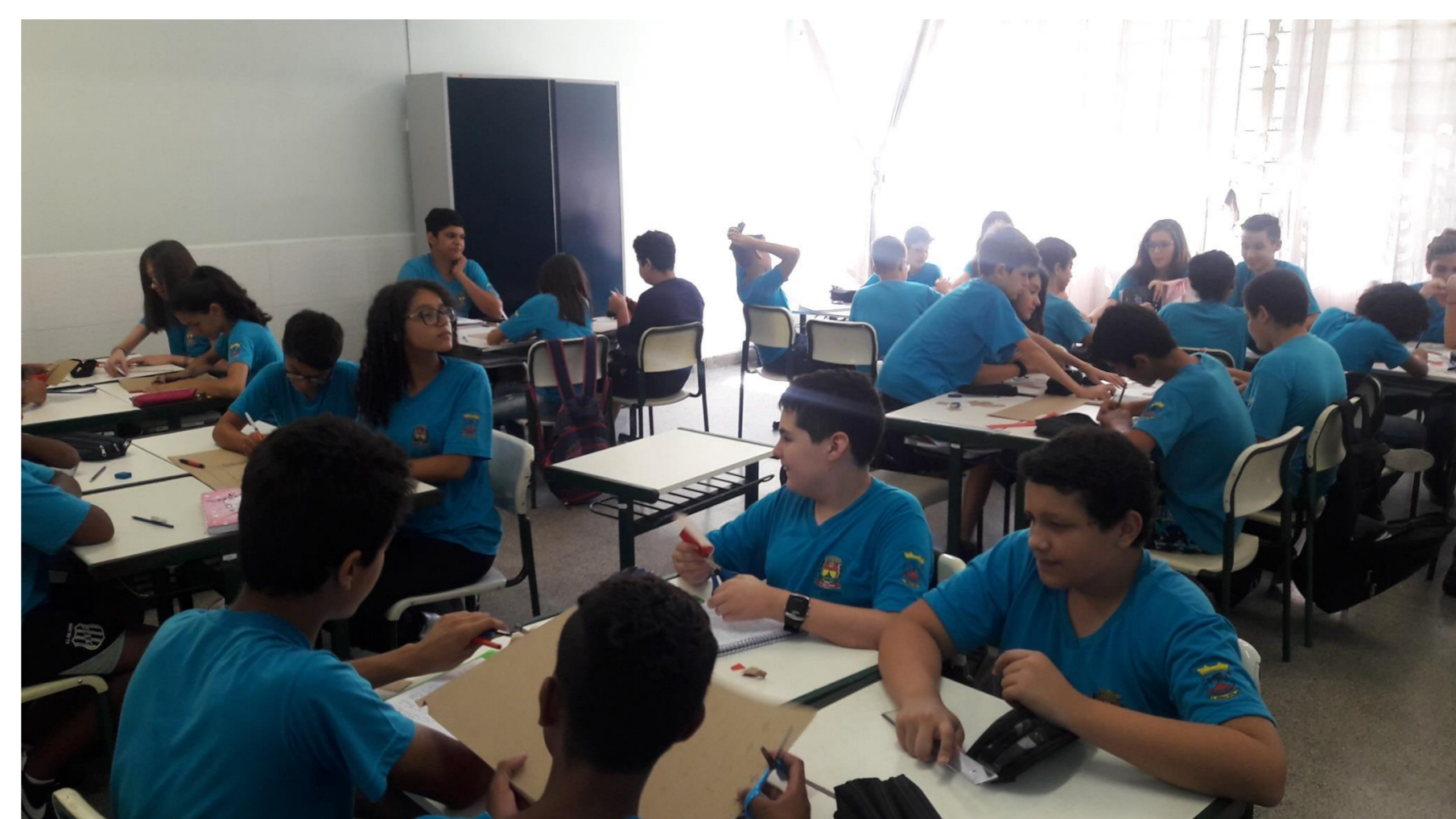
Planejamento e organização