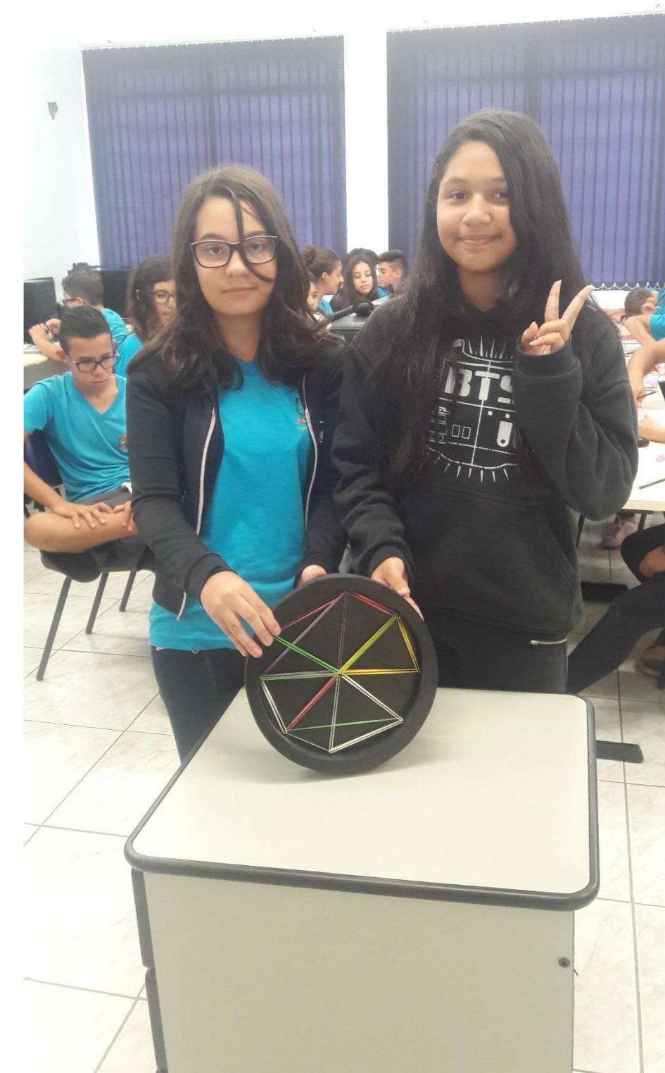
Cordas e Triângulos