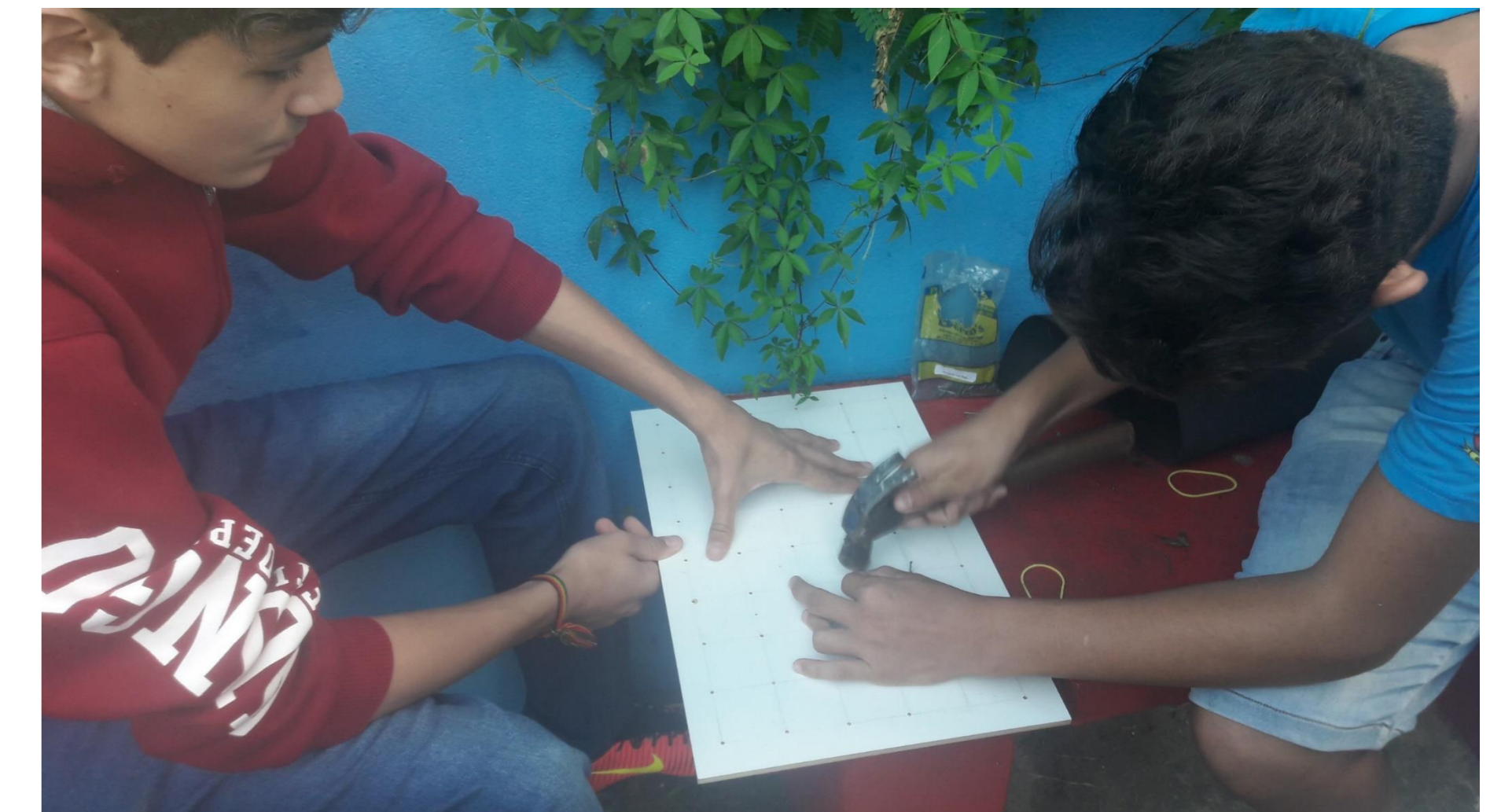
Geoplano e números