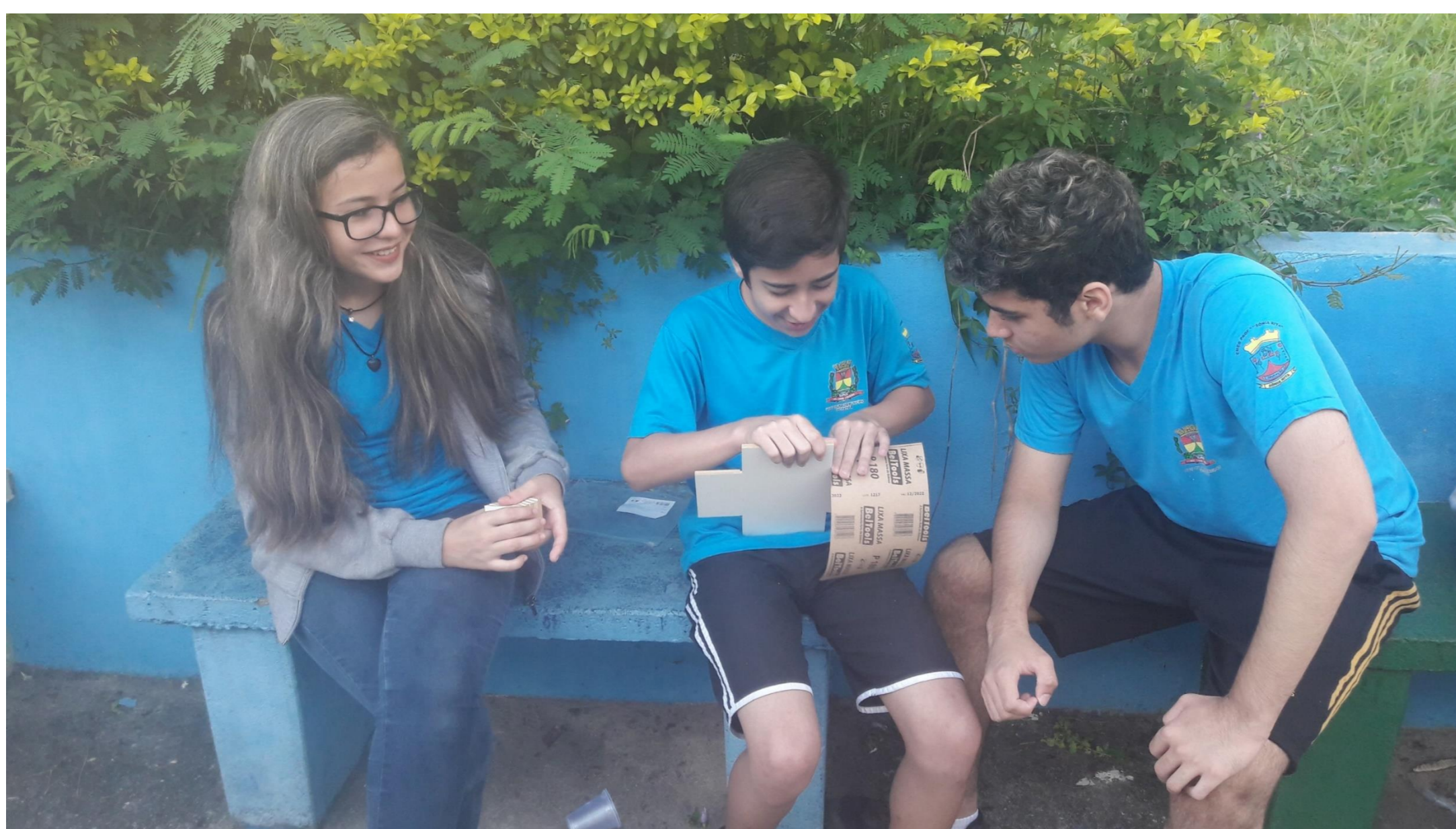
Jogo dos vizinhos